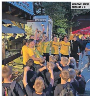
Zmagoviti očetje selekcije U-8