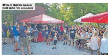
Otroci so odpravili z majicami Kluba Brinje.

V letu 2021 so bili po letu premora spet organizirani štirje turnirski dnevi Grosuplje open, ki so bili zaradi epidemije koronavirusa organizirani na nacionalni ravni brez tuje udeležbe. Turnirje je klub, ob izdatni pomoči staršev, Bork in trenerjev odlično izpeljal, rezultat pa so bili številni nasmejani obrazi otrok.